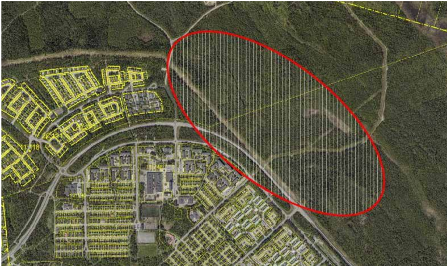
Ett helt nytt bostadsområde planeras på Herstöfältet. Dessutom byggs ny skola, ny sporthall och nytt badhus.

– I grund och botten är det tack vare SSAB som har banat väg. Nu öppnas möjligheten för resten. Vi gör det för att på riktigt bidra till en hållbar omställning. Även om det är svårt så måste vi ha en omställning. Det kommer ge mycket i långa loppen även om det är en tuff och oviss resa till en början.