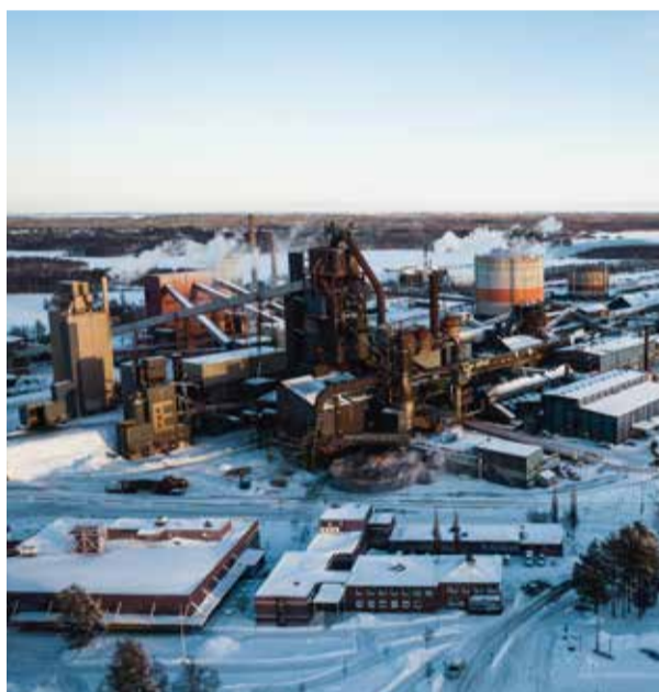
Den gröna industriella omställningen i Luleå får enorma effekter, inte bara för Sverige.

– Fullt utbyggt ökar vi kapaciteten för godsvolymen fyra gånger och blir faktiskt Sveriges näst största hamn efter Göteborgs Hamn. Första steget är muddringen av farleden