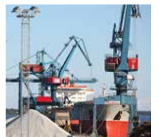
Godsvolymen ökar dramatiskt.

Under kommande år blir det mycket byggtrafik till och från Luleå Industripark.