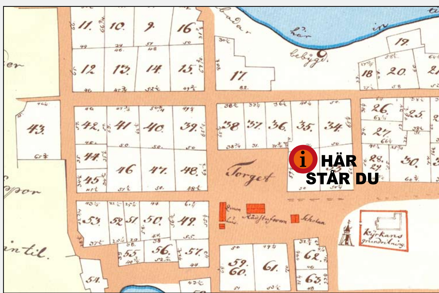
Kvartersindelning och stadens centrum år 1750. Karta Esaias Hackzell/utgiven år 1971 av Luleå kommuns Exploateringskontor.