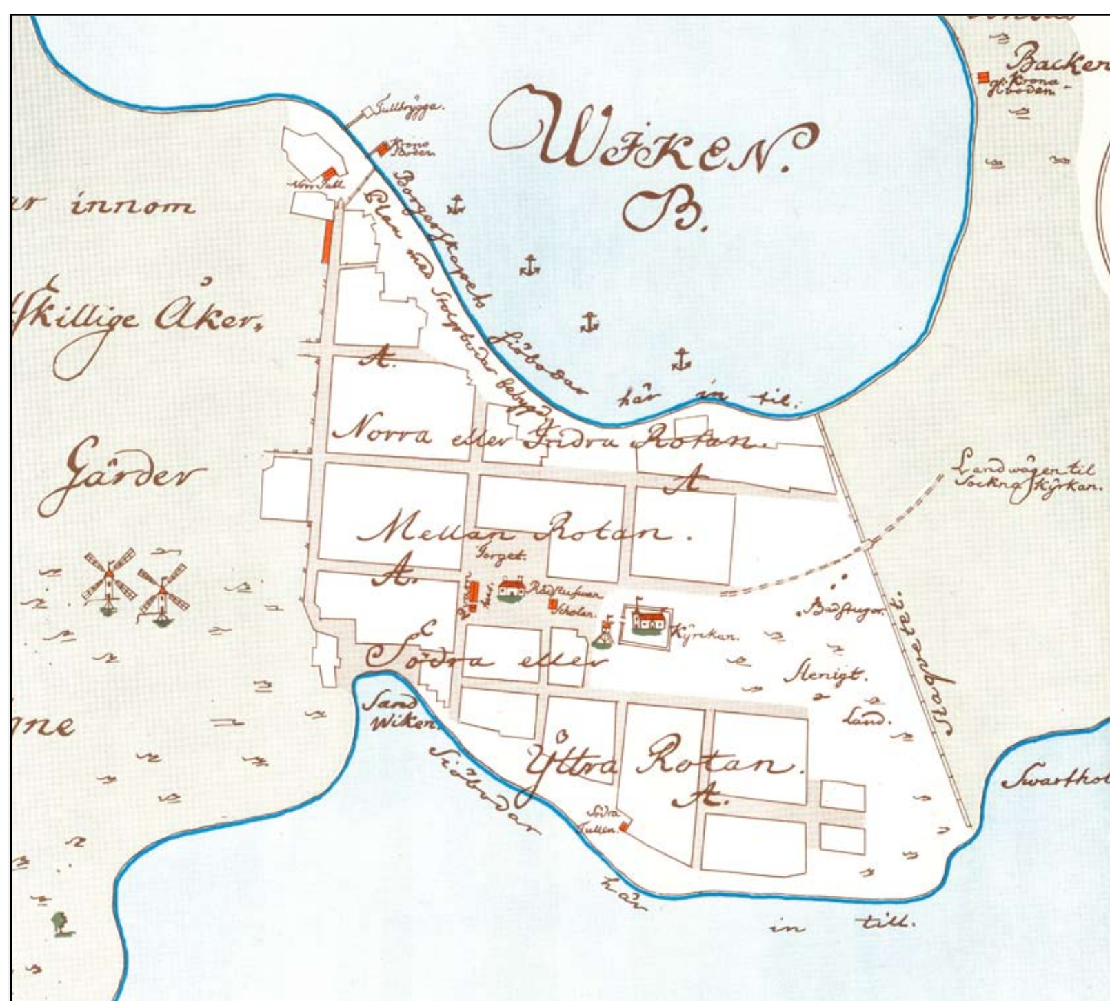
Luleå stad år 1750. Karta Esaias Hackzell/utgiven år 1967 av Luleå kommuns Stadsingenjörskontor.