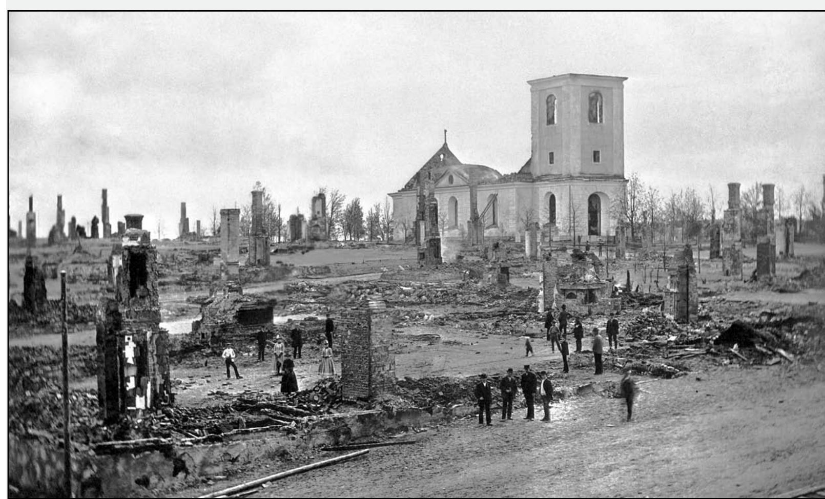
Efter stadsbranden 1887 återstod endast husgrunder och skorstenar där elden härjat.