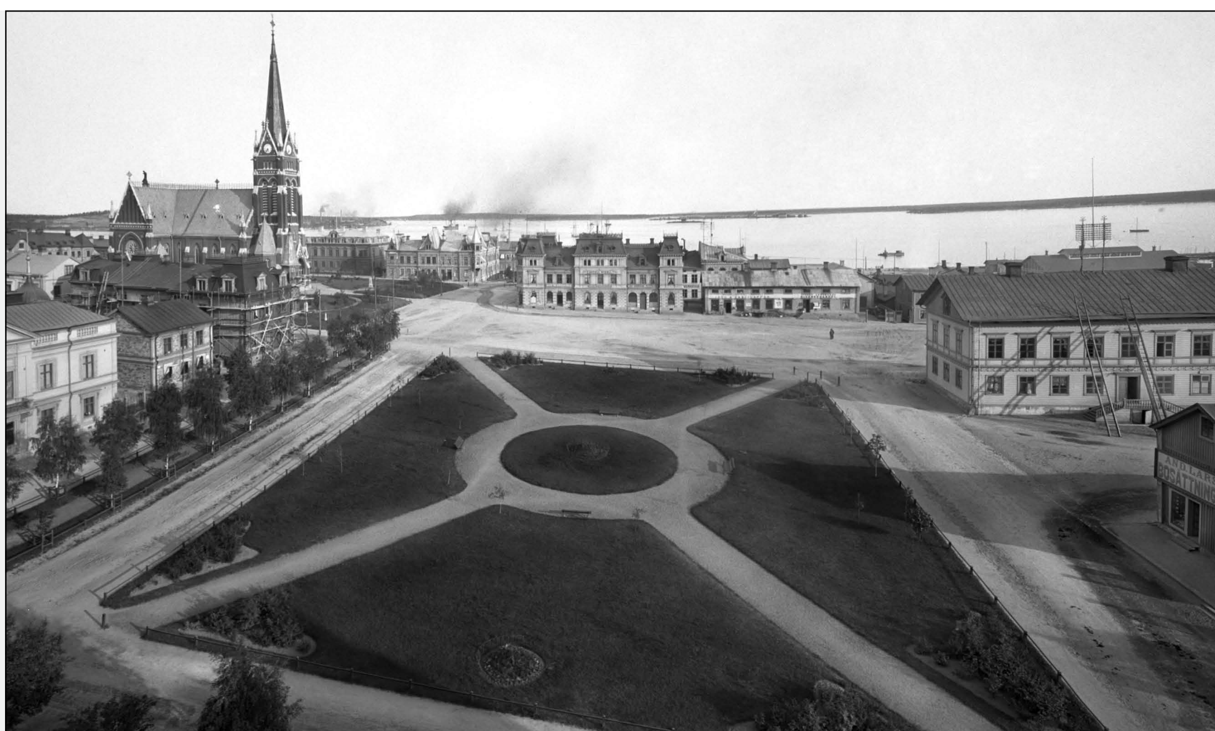
Stadsparken i början av 1900-talet.