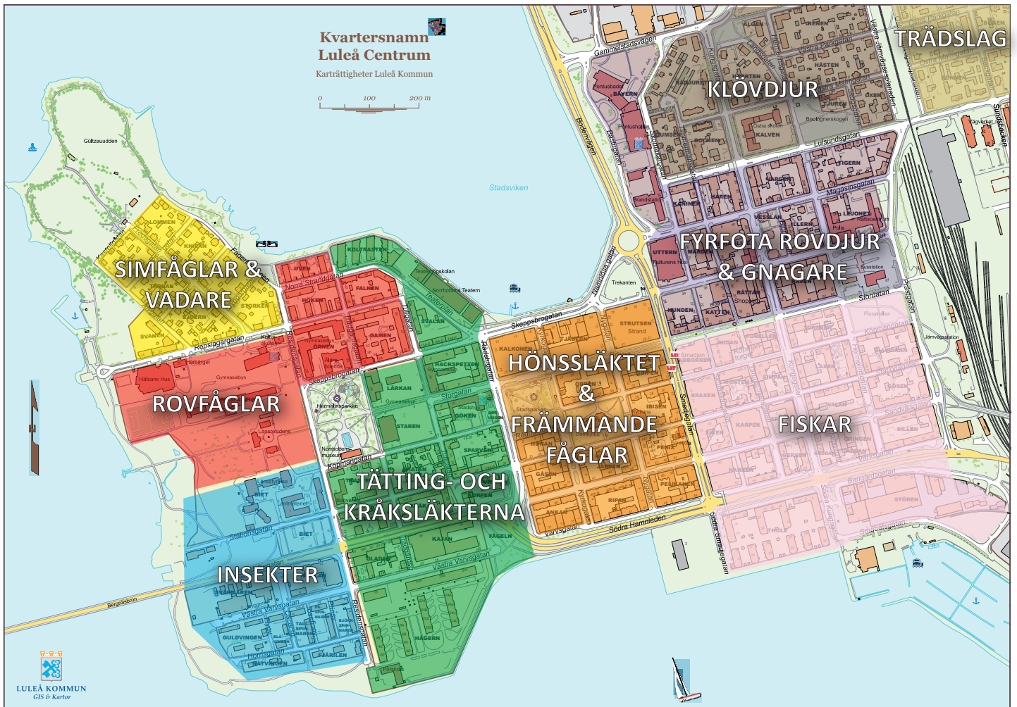
På kartan ser man hur kvarteren har delats in gruppvis.