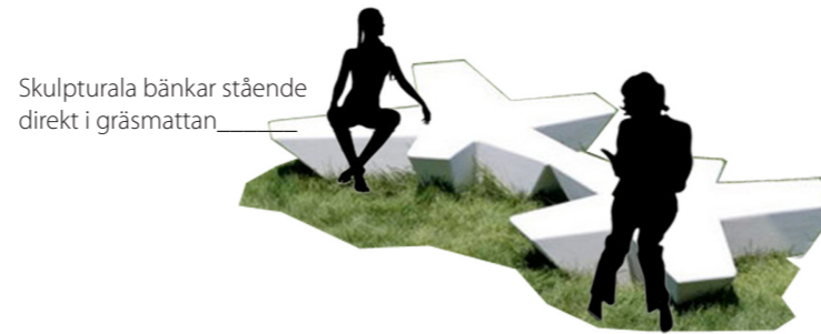
Skulpturala bänkar stående direkt i gräsmattan

Ny diagonal gångväg genom parken löper genom det stora öppna rummet.