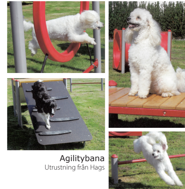
Agilitybana Utrustning från Hags