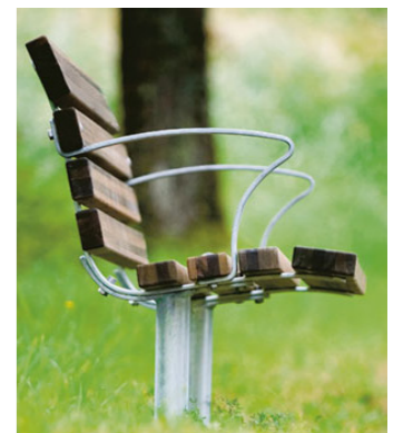
Bänk fastgjuten eller fristående, Slottsbro Anita med trädetaljer i järnvitrolbehandlad lärk och stomme i värmförzinkat stål.