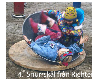
4. Snurrskål från Richter