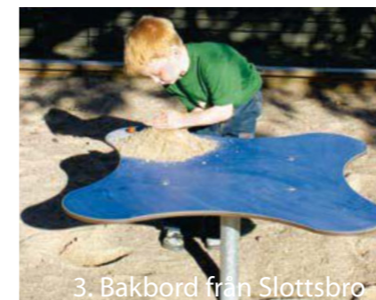
3. Bakkbord från Slottsbro