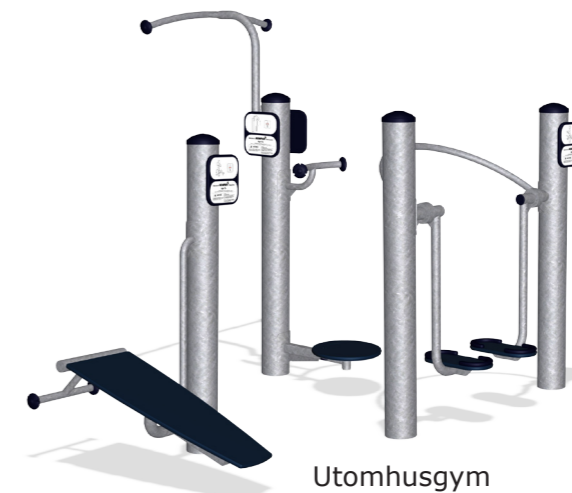
Utomhusgym Utrustning från Kompan