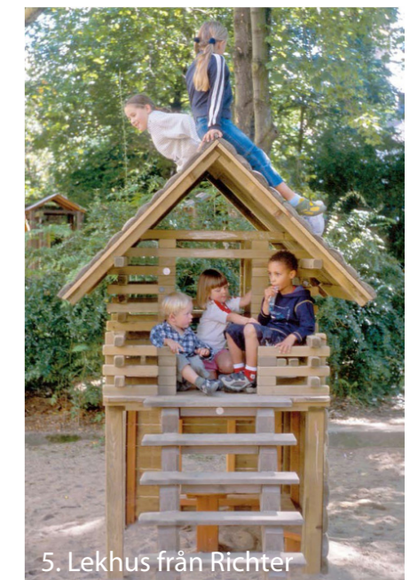
5. Lekhus från Richter