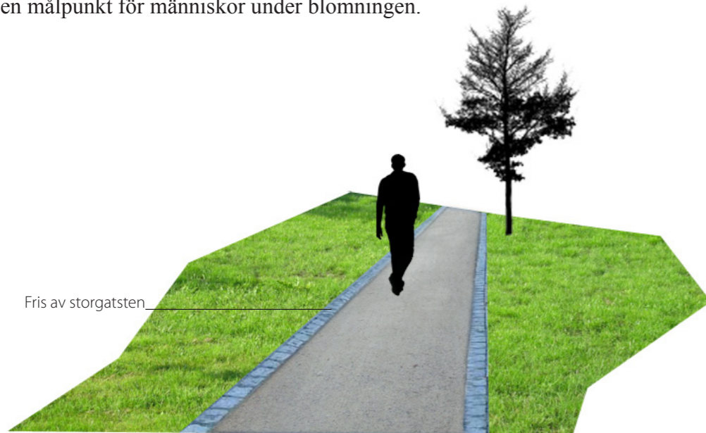
Fris av storgatsten

Stora planteringar av vårbloppande Scilla ger parken en tydlig karaktär och den blir en målpunkt för människor under blomningen.