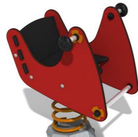
1. Gungdjur från Hags