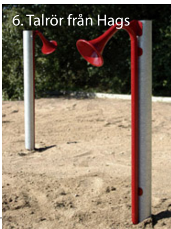
6. Talrör från Hags