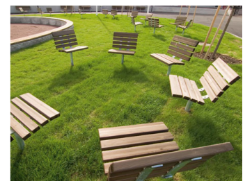
Stolar fastgjutna i gräsmatta, Slottsbro