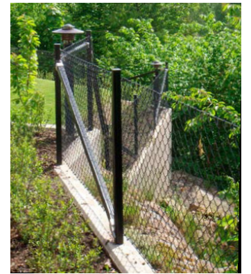
Genomsiktligt svart stängsel med grind, Gunnebo