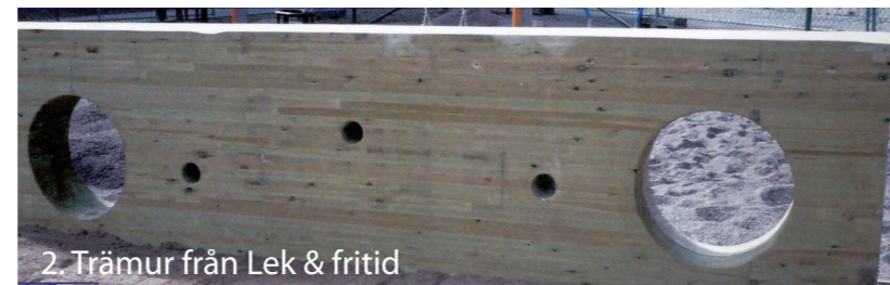
2. Trämur från Lek &amp; fritid