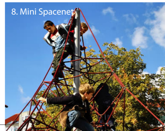
8. Mini Spacenet