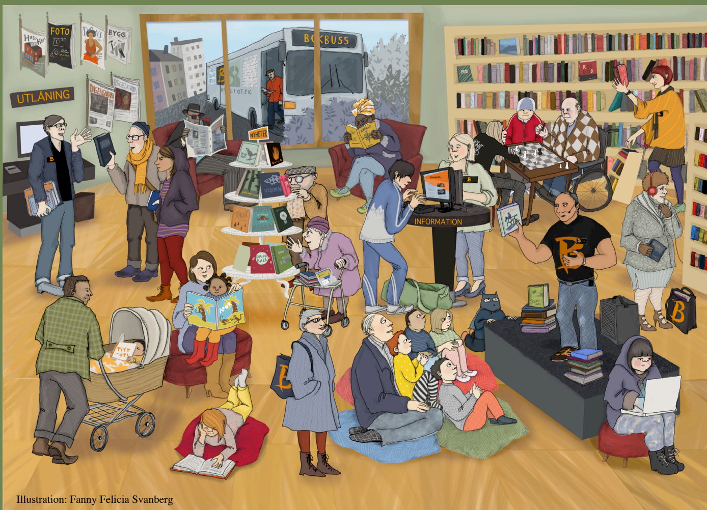
Illustration: Fanny Felicia Svanberg