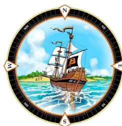
Sjösättning av biblioteksavdelningens nya organisation. Illustration: Lise-Lotte Tjernström

2015 påbörjades planering och genomförande av att biblioteken i Norrbotten ska ingå i den gemensamma nationella biblioteks katalogen Libris, samt ändra klassifikationssystem från SAB till Dewey decimalklassifikation (DDK)**. Det övergripande samarbetet styrs av länsbiblioteket och bibliotekscheferna i Norrbotten genom chefsmöten och en chefsledd styrgrupp. Utvecklingsarbetet skedde i arbetsgrupper där representanter från den regionala biblioteksverksamheten medverkade.